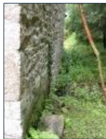
Emplacement de l'ancien coursier

Le moulin est aussi inscrit à l'Inventaire général du patrimoine culturel français.