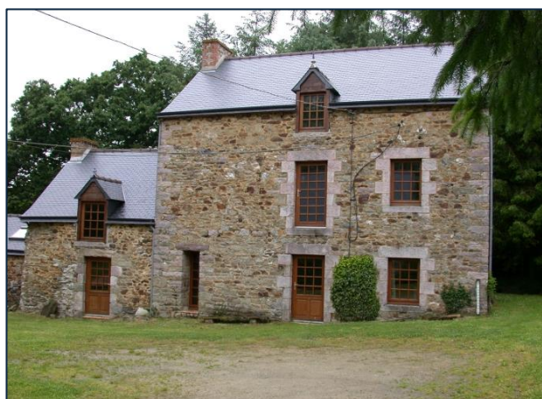
Façade sud du moulin et du fournil

Reconstruit vers 1913, le moulin de Saint-Gueltas a cessé son activité au début de la Seconde Guerre mondiale, vers 1939. Il conjugait énergie hydraulique et énergie thermique avec un moteur à gaz pauvre. Doté de meules, le moulin fabriquait son pain (pâte et cuisson) qu'il vendait.